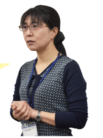
消費生活総合センター相談員

知っていますか? 「契約書がないから大丈夫」と思っている、実は、「買います」と言うだけ(口約束)でも契約は成立してしまいます。消費者トラブルに巻き込まれないために、よくある事例とポイントをご紹介します。契約して後悔する前に、一度、立ち止まって考えてみましょう。その契約は、本当に必要ですか?