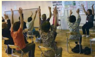
▲富士山体操で、運動機能の低下を防ぎましょう。

介護予防について自ら学習・実践しながら、「お元気で21健診」(取組2)や地域のサロン、お食事会で出前講座を行い、介護予防の取組・必要性などを、地域の皆さんへ伝える活動を行っています。