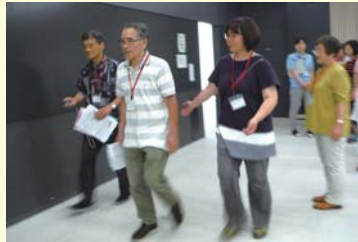
▲5m歩行で、歩く速さなどの歩行能力を確認します。