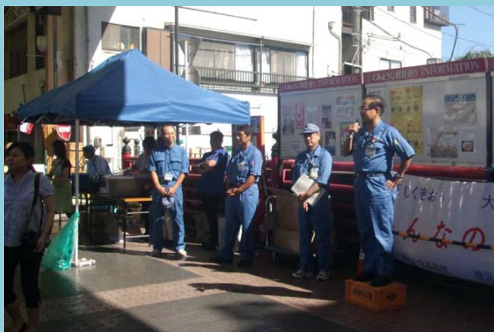
〈秋山所長による開会のあいさつ〉

横浜弘明寺商店街協同組合の皆様にも多大なる協力をいただきまして、 ことしも共催イベントとなりました。