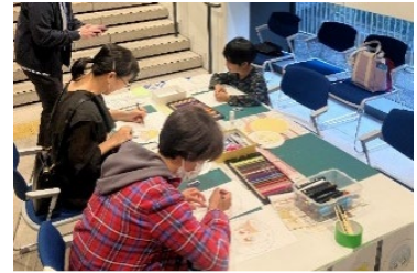
ワークショップのイメージ 長机2本、定員6～10名程度