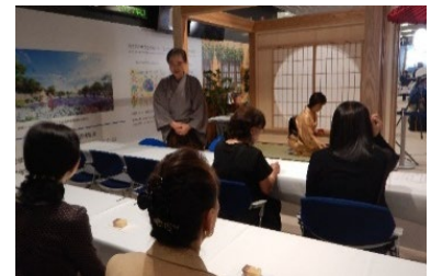
茶席と客席の様子