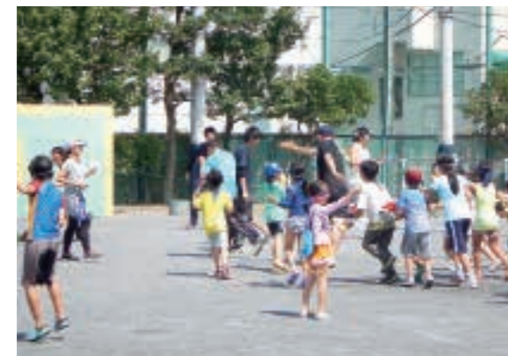
「学校に泊まっちゃおう会」

実は、太田地区のスローガン『幸福！満腹！声かけ！太田地区！』のポスターも、清陵高校の生徒さんが作ってくれたんだよ。