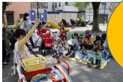
(↑ 令和元年度の撮影です)

毎週木曜日の午前中に 井土ヶ谷保育園の 育児支援保育士が 公園に出向き 「てくてくひろば」を 開催しています。