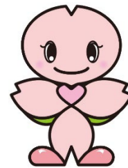
南区マスコットキャラクター みなっち

〈阪東橋駅より〉 4番出口より出て、上大岡方向に進み、医大通りを左折。市民総合医療センター（市大病院）を越え、道場橋を渡る。中村小学校の隣がしろばら保育園です。