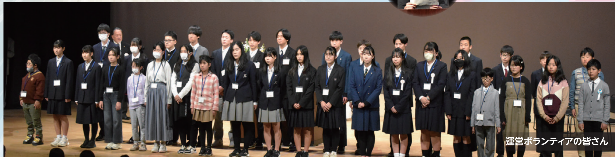
運営ボランティアの皆さん