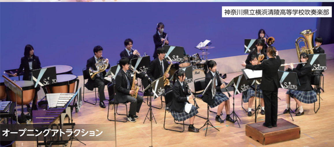
神奈川県立横浜清陵高等学校吹奏楽部