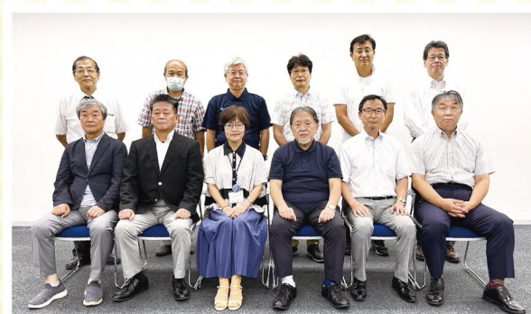
南区区連会承認第9号