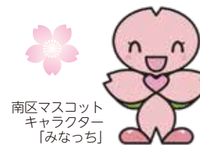
南区マスコット キャラクター 「みなっち」