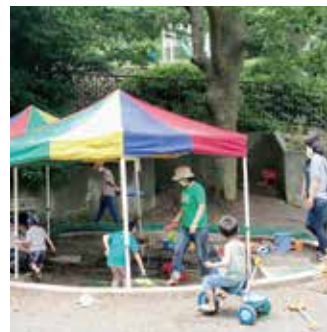
くみょうじプレイパーク