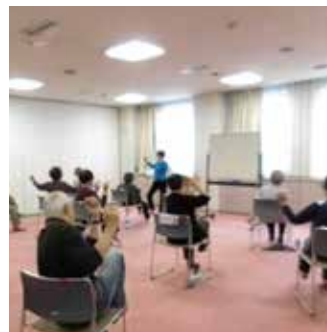
元気づくりステーション「遊友」