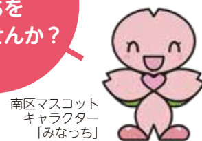
南区マスコット キャラクター 「みなっち」