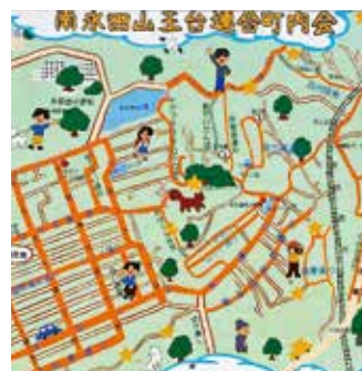
道の愛称プロジェクト (ふるさと創生の会事務局)