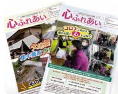
地区社協広報紙「心ふれあい」