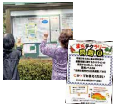
健康づくり事業 「まちテクラリー」