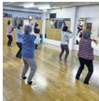
元気づくりステーション 「いきいきダンベル体操教室」