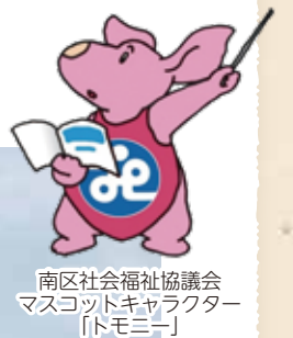
南区社会福祉協議会 マスコットキャラクター 「ドモニー」