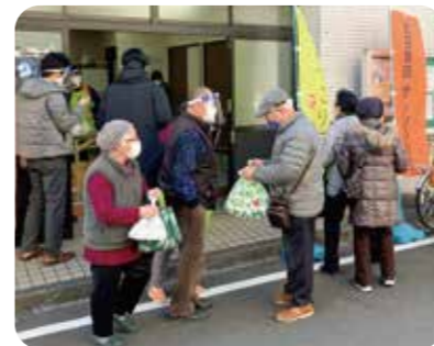
高齢者の居場所「ひよっこり茶屋」