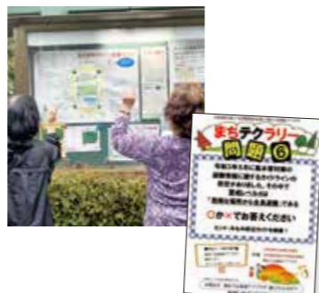
健康づくり事業 [まちテクラリー]