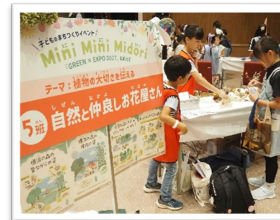
こどものまちづくりイベント 「Mini Mini Midori」 ～『GREEN×EXPO 2027』に向けて～