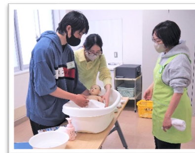
プレパパ・プレママ教室