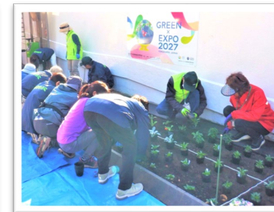
花と緑のサポーターによる 花壇の植え付け活動