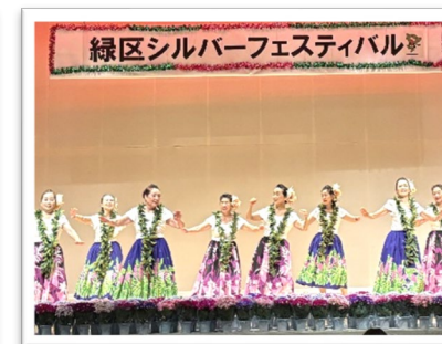
緑区シルバーフェスティバル