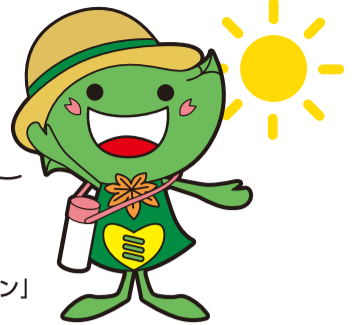
緑区キャラクター「ミドリ」