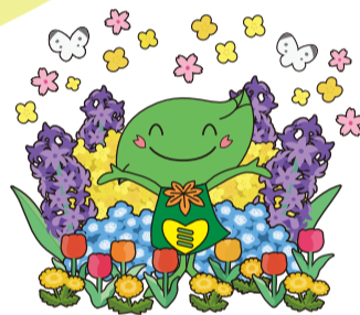
緑区キャラクター「ミドリ」

いよいよ2027年3月19日に 横浜グリーンエキスポが開幕！ 十日市場駅は玄関口の1つになります。 来場者をお迎えする、 ここ緑区から、盛り上げます！！