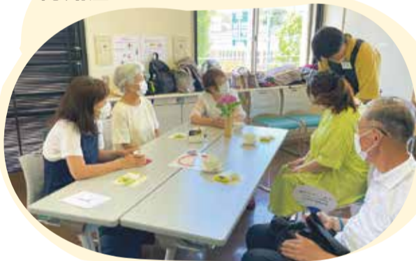
オレンジカフェ (新治中部地区)

認知症の人や家族、地域の人など、誰もが気軽に立ち寄り、情報交換や相談ができる場です。