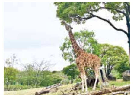
葉っぱを食べようとするキリン

「世界キリンの日(6月21日)」に合わせ、キリンについてより知っていただけるようなイベントを開催する予定です。お見逃しなく!