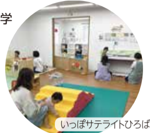
いっぽサテライトひろば

いっぽ・いっぽサテライトは、妊娠中の人、未就学児とその保護者が気軽に利用できる場所です。子どもと一緒に遊んだり、おしゃべりしたりできるひろばがあり、絵本やおもちゃを取りそろえています。赤ちゃんがゆったり過ごせるスペースもあります。