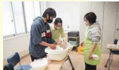
もくもく 沐浴実習