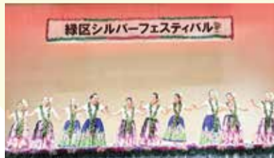
緑区シルバーフェスティバル