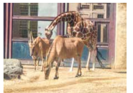
エランドの匂いを嗅ぐキリン

以下は広告スペースです。「広報よこはま」に掲載されている内容とは関係ありません。