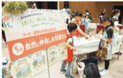
ミニミニミドリ Mini Mini Midori ～「GREEN×EXPO 2027」に向けて～