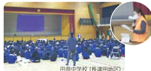
田奈中学校 (長津田地区)