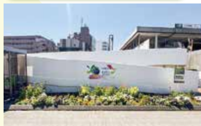
十日市場駅北口「ウェルカム花壇」