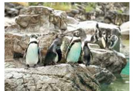
野生での暮らしが想像できる、自然の岩場を模した展示場

日本では飼育している動物園や水族館が多いことから、身近に感じられるフンボルトペンギンですが、野生では餌となる魚の乱獲などにより個体数が大幅に減少しています。ズーラシアでの姿を見ながら、ぜひ野生での暮らしにも思いをはせていただきたいです。