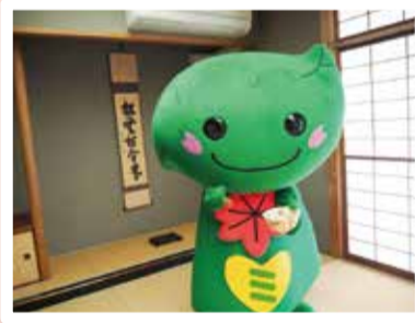
長津田地区センター(和室)