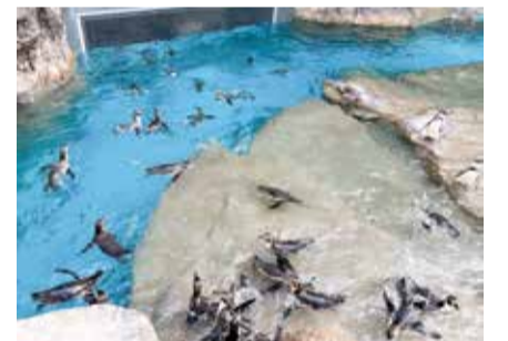
約50羽の群れが一斉に餌を食べる様子は迫力満点