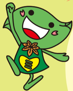
緑区キャラクター 「ミドリン」