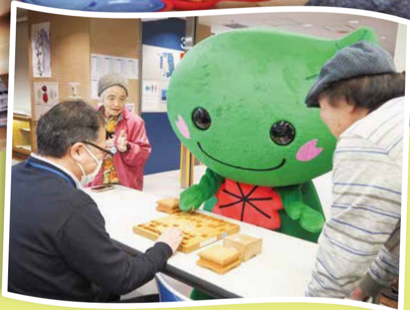
老人福祉センター横浜市緑ほのぼの荘

緑区には皆さんが誰でも利用できる施設がたくさんあります。 趣味の講座を受けたり、運動をしたり、仲間と活動したり。 まだ行ったことのない施設があるかもしれません。 キーワードラリーを楽しみながら各施設を巡ってみませんか？