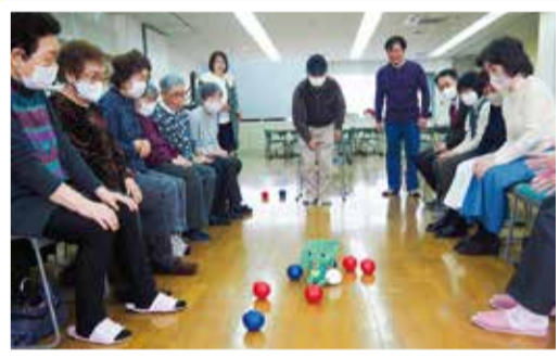
竹山小学校コミュニティハウス(多目的ホール)

霧が丘・東本郷小学校・いぶき野小学校・竹山小学校・森の台小学校・山下みどり台小学校