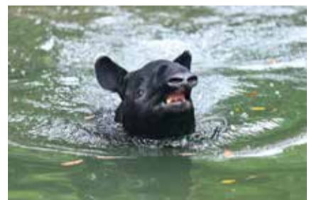
泳ぎもとても得意です!

以下は広告スペースです。「広報よこはま」に掲載されている内容とは関係ありません。