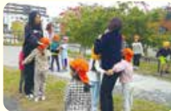
ゲームの楽しさは、世界共通！

【問合せ】 区学校連携・こども担当 Tel 930-2216 Fax 930-2435