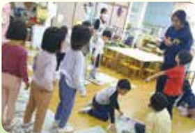
英数字を聞いて、新聞紙に集まるゲーム中