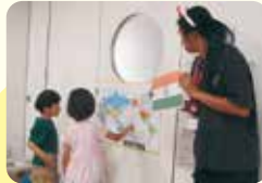
世界地図や国旗への興味が広がります

遊びの中でわくわくする体験が、子どもたちの「意欲」や「探求心」といった力を養うのにとても大切です。子どもたちが「やってみよう！」と思い夢中になって遊ぶことによって、自分なりの発見や学びが得られるようです。この経験が、子どもたちの未来にもつながっていくといいなと思っています。