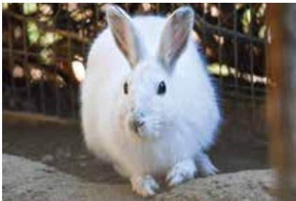
冬の間は白い毛をしています