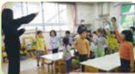
英語の歌を歌って元気いっぱいな子どもたち