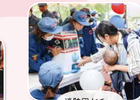
消防団がチャ 何が出るかな?