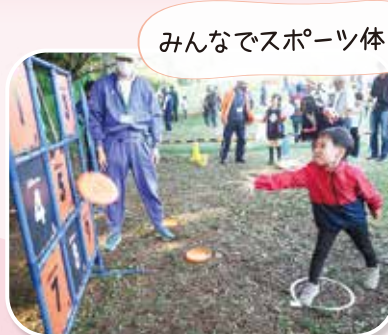
みんなでスポーツ体験