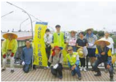
▲みどり・川と風の会の メンバー