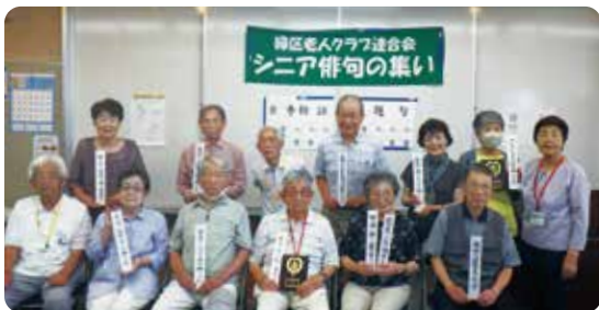
シニア俳句の集い