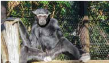
オスは黒く、頭の帽子の縁が白い