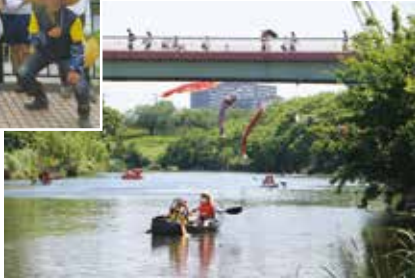
▼カヌーを楽しむ会 (5月)の様子