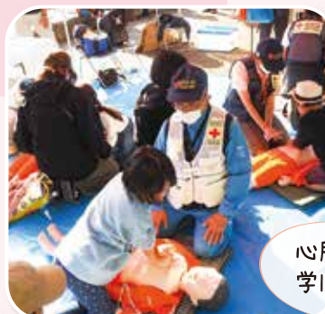
心肺蘇生法を 学ぼう