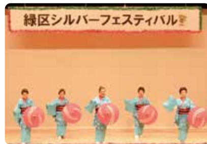
シルバーフェスティバル (演芸発表会)