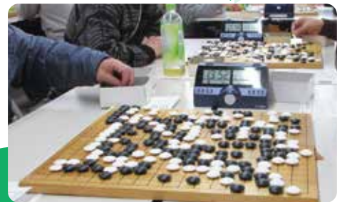
緑区役所共催事業