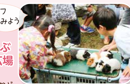
モフモフ 触ってみよう