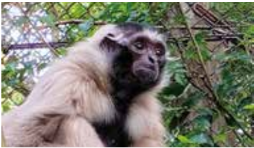
メスは顔とお腹以外は白い

ボウシテナガザルはタイからカンボジ アにかけて生息しています。その名の 通り頭に帽子をかぶったような毛の生 え方をしている、オスは黒、メスは白と 雌雄で色がはっきり分かれています。 敵の少ない高い木の上で、木の葉や 実などを食べて生活しており、長い腕 を使って体を振り子のように揺らして 隣の木へ移動します。雌雄でペアを作 り、お互いのコミュニケーションのため に雌雄でパートが分かれる複雑な音程 の鳴き方をし、その声の届く範囲がそ のペアの縄張りといわれています。 野生のボウシテナガザルは、森林破壊 により生活する森が少なくなり現在 47,000頭まで減っています。日本国 内では12頭しか飼育されていない珍 しいテナガザルです。