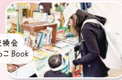
本の交換会 かえっこ Book