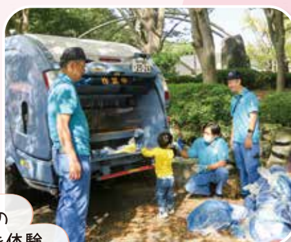
ごみの 収集を体験