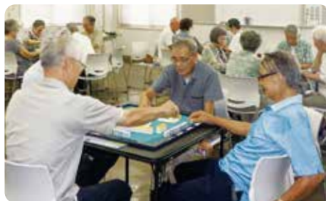
健康マージャン交流会