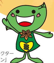
緑区キャラクター 「ミドリん」