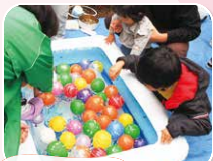
うまく取れるかな?