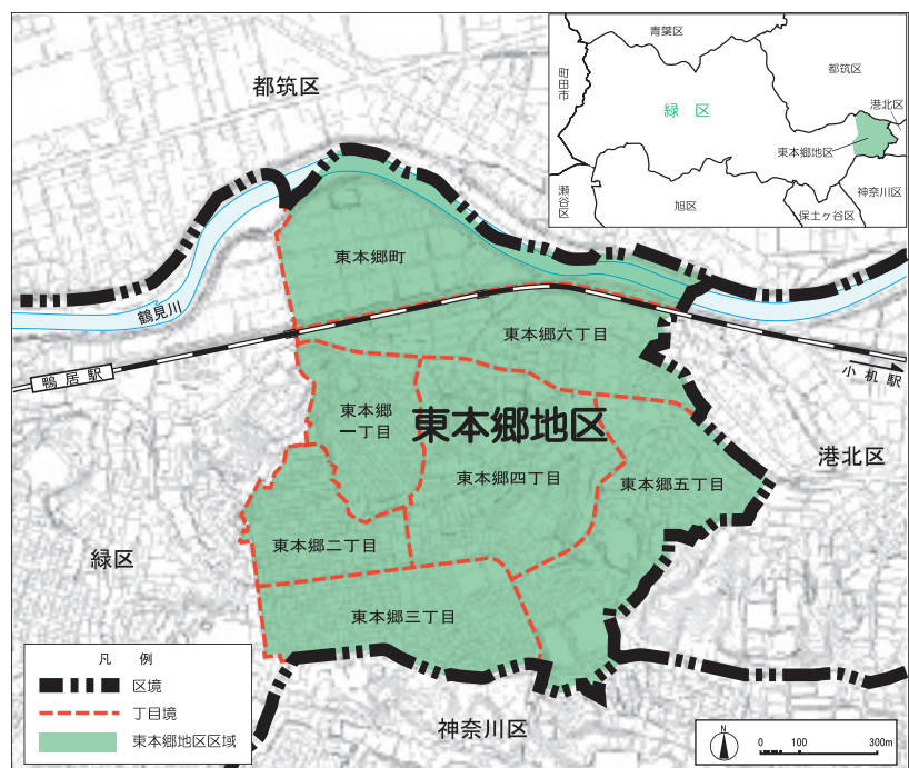
東本郷地区の区域

本地区は緑区の東端に位置し、都筑区、港北区、神奈川区と接しています。都筑区との境には鶴見川が流れています。