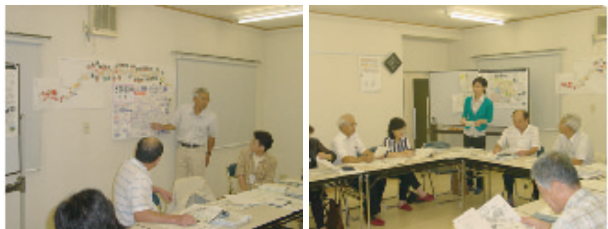
東本郷まちづくり協議会の様子

今後は、東本郷連合自治会、東本郷まちづくり協議会と行政が、一層、緊密な連携を取りながら、アクションプランに基づいて、事業やルールづくり等の具体的な行動を起こしていきます。