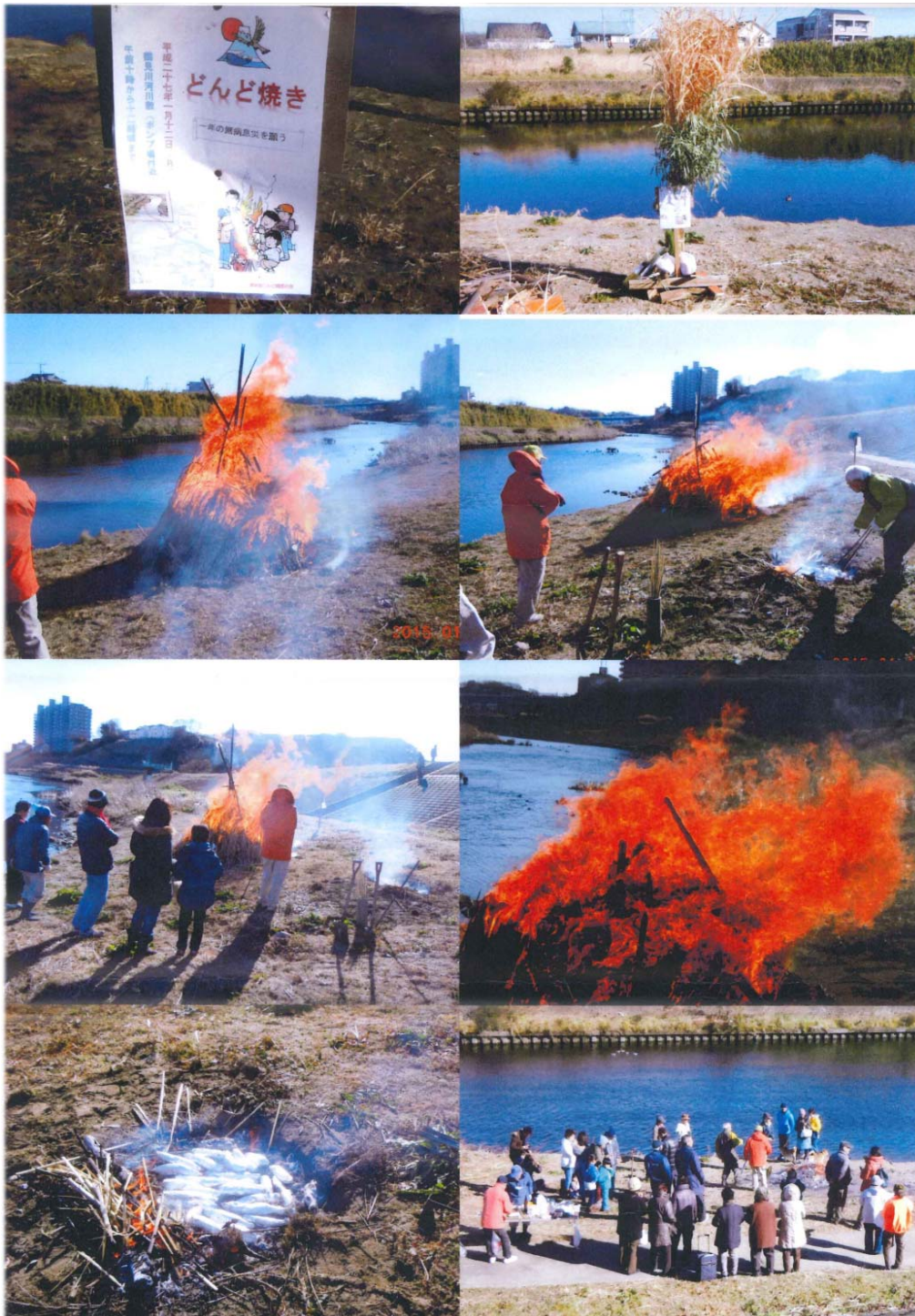
どんど焼き 平成27年1月