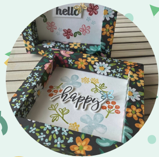
額とスタンプアート