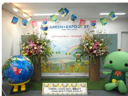
フォトスポットイメージ