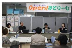
Open! みどリーむ Vol. 26