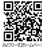
みどリーむホームページ

◎：申込不要 ★：要事前申込 △：申込締め切り済 ◆：みどリーむ登録団体主催事業 ★日本語：外国につながるのある人対象の日本語教室（午前） ◎PCス：パソコン・スマホなんでも相談（午後）