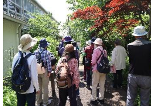
自然を楽しむ講座