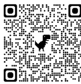
申込二次元コード