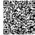
第3回 申込二次元コード