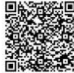
第2回 申込二次元コード