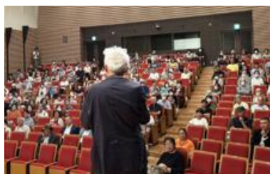
2025 年 7 月みどりアートパーク シベリア抑留の映画上映と監督のお話