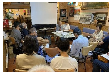
2025 年 10 月純喫茶ウエーク 戦争体験者の生の声を聞く会