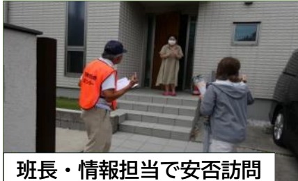
班長・情報担当で安否訪問