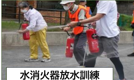
水消火器放水訓練