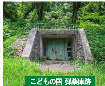
こどもの国 弾薬庫跡