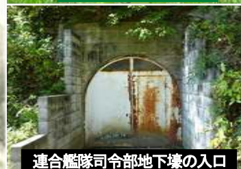
連合艦隊司令部地下壕の入口