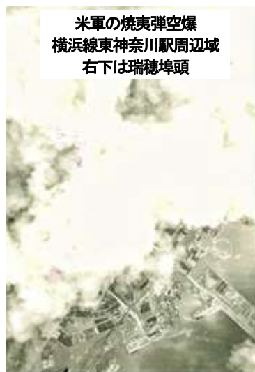
米軍の焼夷弾空爆 横浜線東神奈川駅周辺域 右下は瑞穂埠頭

今年は戦後80年です。緑区と近隣の地域では、この戦争の時にどのようなことが起きていたのでしょうか。そんな出来事を今なお残る痕跡を辿りながら紹介します。当時の緑区域は旧港北区で、ここに東京陸軍兵器補給廠田奈部隊や旧海軍連合艦隊の司令部が置かれていました。そんな痕跡などを巡ります。