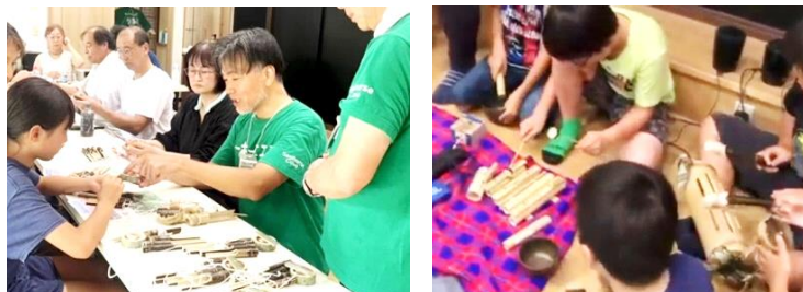
緑区三保にある「忠暘院」でのワークショップの様子

シーホース工房の手作り楽器ワークショップの醍醐味は、「作って終わり」ではなく、「演って（やって）終わる」こと。参加者が一体となって音のアンサンブルを楽しむことを実現しています。楽器の材料には、緑区三保などの竹林で間伐した竹を利用しています。シーホース工房は竹林間伐の活動にもさらに力を入れていきます。