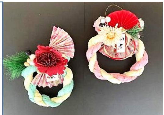
第3回工作(お正月かざり)