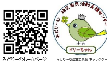
みどリーむホームページ

〒226-0019 横浜市緑区中山4-36-20 TEL: 045-938-0631 ✉ md-shiencenter@city.yokohama.lg.jp FAX: 045-939-5401 9:00~21:00開館(日曜・祝日は17:00まで) JR横浜線、市営地下鉄グリーンライン中山駅南口より徒歩7分 ※ 駐車場はありません。公共交通機関でご来館ください。