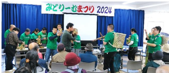
みどりのなかまたち 2024 での発表の様子

また、音楽イベントやコンサート等にも積極的に参加しています。令和6年3月に行われた「みどりのなかまたち 2024」では、紙芝居ミュージカル「竹の里ものがたり」を披露。絵と朗読で構成される紙芝居+リアルな配役と音楽・音響の実演を取り入れたシーホース工房独自の表現方法で、観客を魅了しました。