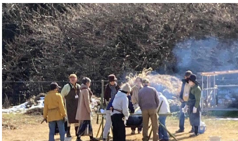
竹細工講座に使う竹の油抜きをしているボランティアの皆さん