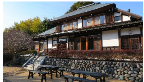
どなたでも利用でき、集うことのできる主屋(旧奥津邸)

ボランティア活動を始めてもらうためには、“いつ、どこで、何をするか、あなたにとってきつといいこともある”と具体的な言葉で発信していくことも必要ですね。