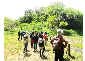
令和5年度「自然を楽しむ」の様子 ～新治市民の森～