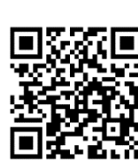
みどリーむホームページ