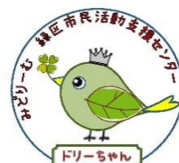
みどリーむ運営委員会 キャラクター

発行：緑区市民活動支援センター 運営委員会広報情報部会 緑区市民活動支援センター「みどリーむ」 〒226-0019 横浜市緑区中山4-36-20 TEL:045-938-0631 ✉md-shiencenter@city.yokohama.lg.jp FAX:045-939-5401 9:00~21:00開館(日曜・祝日は17:00まで) JR横浜線、市営地下鉄グリーンライン中山駅南口より徒歩7分 ※駐車場はありません。公共交通機関でご来館ください。