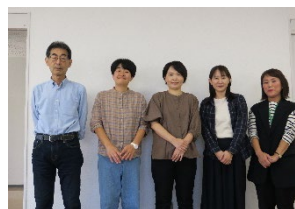
運営委員の皆さん 私たちが企画しました。

自分に務まるか不安でしたが、協力して成し遂げることができた良い経験になりました。(【YU】)