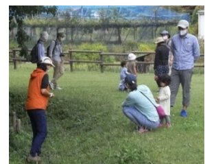
親子で参加する講座“にいहार自然じかん”

3年生に目の前の森を指さし、「昔は杉や檜で家を作り、雑木を薪にして暮らしていた」と伝えると里山の役割を理解してくれます。また、3～6歳児の親子が自然の中でリラックスして楽しめるように、森の中でのルールや遊び方を伝える講座もあります。