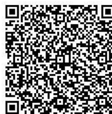
横浜線ものがたり講座 申込先 二次元コード

《e-mail》md-midreamkouza@city.yokohama.jp