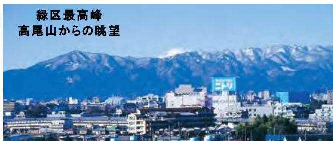
緑区最高峰 高尾山からの眺望

今年は緑区制55周年、そしてパリでオリンピックが開催されます。そこで、いろいろな視点での緑区の見どころNo.1・金メダルは何かを、横浜線四駅をベースに一緒に探してみませんか。緑区には奥深い歴史とそこに培われた文化や自然があります。春爛漫の風景の中で、我が町の魅力をじっくりと味わってみましょう。GoGo！