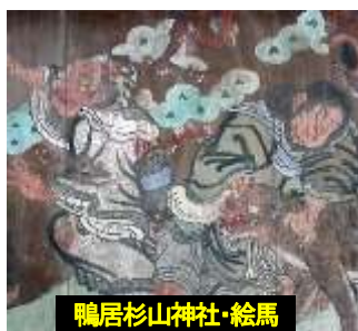
鴨居杉山神社・絵馬