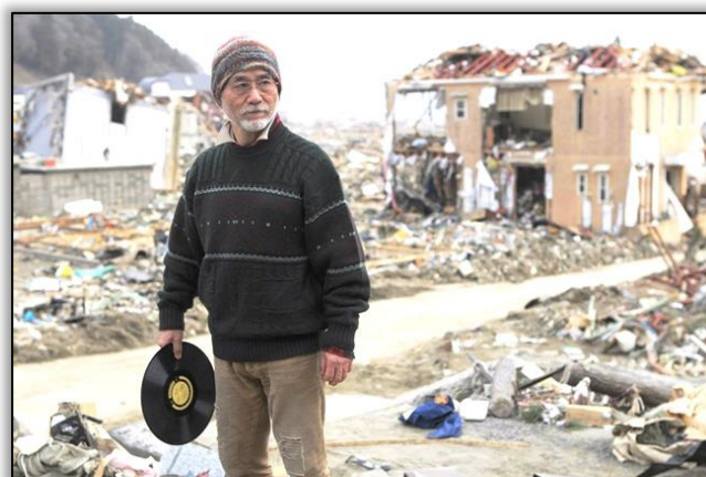
被災直後のジャズ喫茶 店主