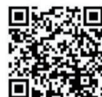
みどリーむ運営委員会 YouTube