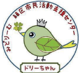
みどリーむ運営委員会 キャラクター