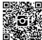
ちよっと先生公式 Instagram