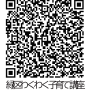
緑区わくわく子育て講座

【対象・定員】 未就学児をお持ちの保護者15人(抽選) (原則全回出席できる方)