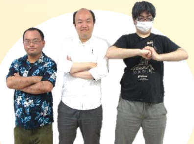
サブカル部ラジオ局! ～誰でも参加できる クセが強いラジオ局です～