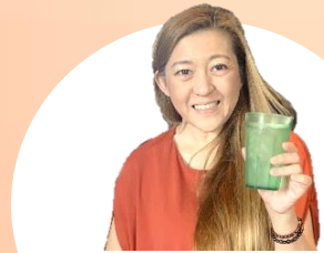
オリオアタヒチ～ハッピーダンス～ ～南国の音楽に合わせて 楽しく踊りましょう～