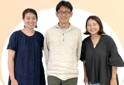
NPO法人 霧が丘ぶらっとほーむ ～人と人がつながる コミュニティカフェ～