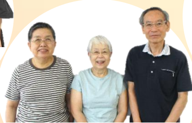
NPO法人 たすけあい・ゆりの木 ～ゆる～くつながる街の縁側 お散歩カフェ～