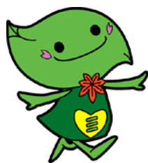
緑区キャラクター 「ミドリン」