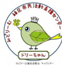
みどりーむ運営委員会 キャラクター

お申込み方法：e-mail、ハガキ又は「受講申込書」に、住所・氏名・年齢・電話番号・e-mail、受講講座の種別とこれまでの緑区生涯学級講座受講経験の有無を記入して、下記宛にお送り下さい。