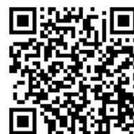
みどりーむ 講座申込先

《e-mail》md-midreamkouza@city.yokohama.jp