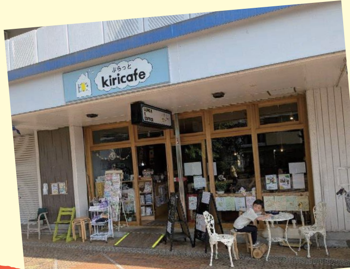
コミュニティカフェ「ぶらっと kiricafé」(霧が丘) 第2講で訪れます!