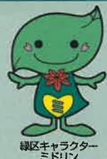
緑区キャラクター ミドリ