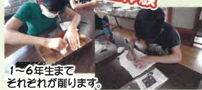
1~6年生まで それぞれが削ります。 メスティン炊飯