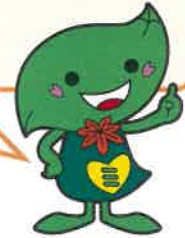
緑区キャラクター ミドリん

緊急事態宣言後に行事を再開した地区、密を避けられるよう工夫して新しい行事を行った地区、残念ながら活動を見送った地区など様々ありますが、そんな令和3年の今を記録するため、今号では各地区活動をご紹介します。