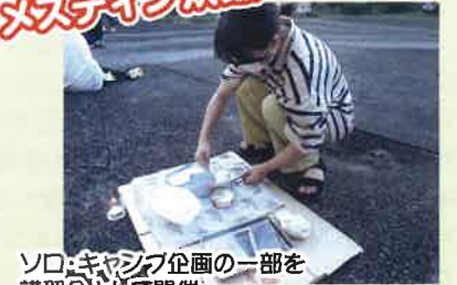
ソロ・キャンプ企画の一部を 講習会として開催。 一人前を自分で作ります。