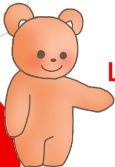
Midori Library Character Bookuma

Let's enjoy different languages together!