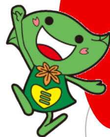
緑区キャラクター ミドリ

※1回目と2回目の内容はちがいます。 ※こんな絵本や紙しばいをよみますよ！ 絵本『サンドイッチサンドイッチ』（福音館書店） 紙しばい『ともだちだーれ？』（童心社） など