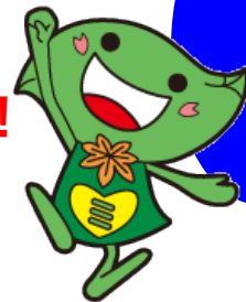
Midori Ward Character Midorin

Stories will be read aloud in Japanese, English, and Chinese.