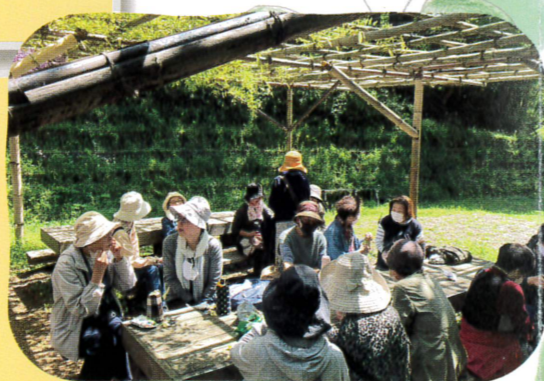
▲元気づくりステーション里山会のウォーキングイベント