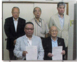
「三保どんぐりの会」