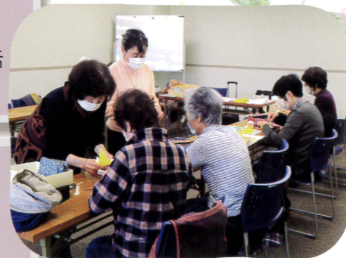
▲折り紙サークル (さんさんルーム2号館)