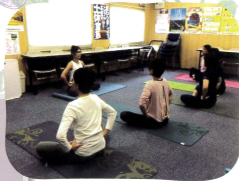
▲ヨガサークル (さんさんルーム1号館)