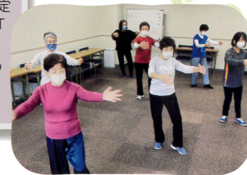
▲太極拳サークル (さんさんルーム2号館)