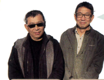
小川会長 喜多副会長

5月のウォークラリーでは三保の色々な場所を歩いて巡り、11月の子どもフェスタでは芋煮や餅つき、昔遊びなどをやっています。どなたでも参加できますので、どうぞいらっしやってください。