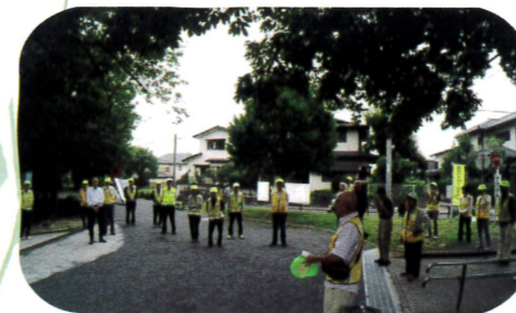
▲合同防犯パトロールの様子