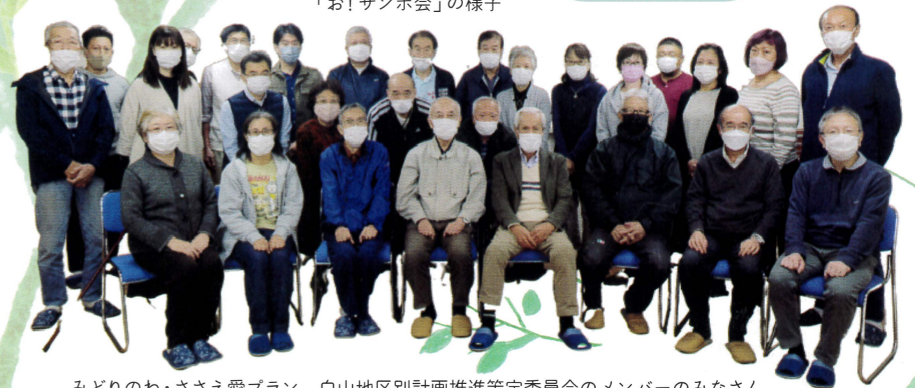
みどりのわ・ささえ愛プラン 白山地区別計画推進策定委員会のメンバーのみなさん