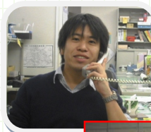
地域活動交流職員