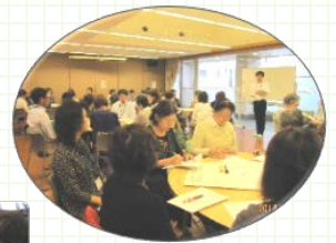
参加者 46 人！