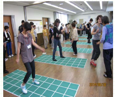
リーダー養成講座の様子

現在、スクエアステップは地域の体操会やケアプラザ等で定期的に取り組まれており、誕生された東本郷の16名のスクエアステップリーダーさんは今後の活躍が期待されています。また体験されている方からは“足の運びが良くなった”“楽しい！”等の嬉しい声が寄せられています。今後も東本郷地域の皆さまの体（筋力・バランス力）、脳（集中力・記憶力）、心（笑い・交流）の健康向上を目指し活動を充実させていきたいと考えています。