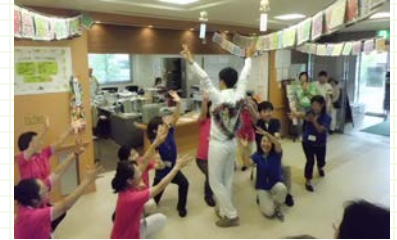
職員有志で結成したふくちゃんズ。7周年祭りのオープニングで「空に太陽がある限り」を踊りました。