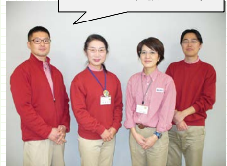
地域包括支援センターと地域交流担当職員