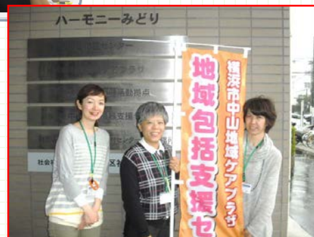
地域包括支援センター 職員