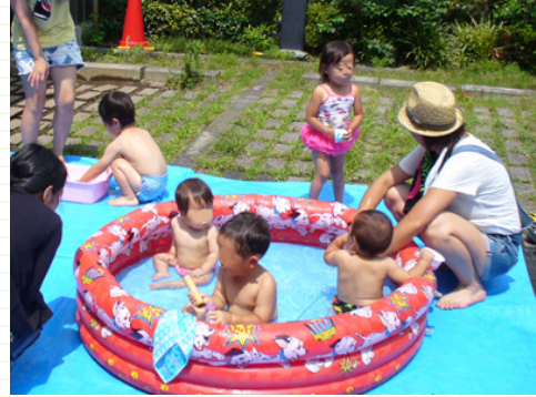
～子育てサロン（水遊び）の様子～

子育てサロン“ひがほん”では、夏休みに水遊びを実施しました。地域の方や中学生ボランティアのご協力もあり、今年度は水風船ヨーヨーがプレゼントされるなど、乳幼児たちは大はしゃぎ！！