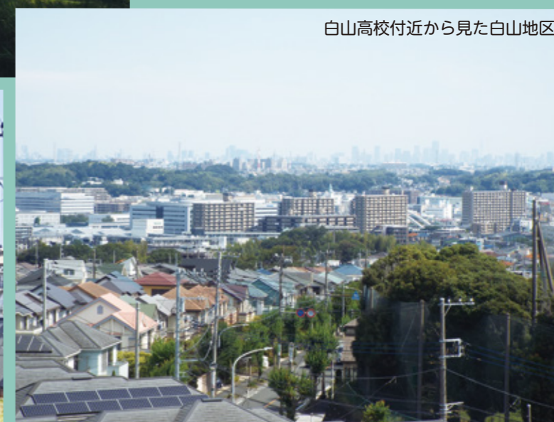
白山高校付近から見た白山地区