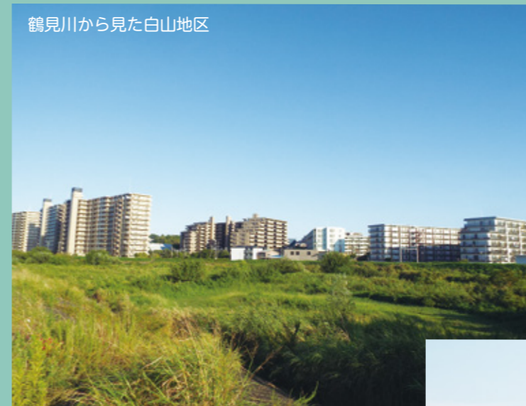
鶴見川から見た白山地区