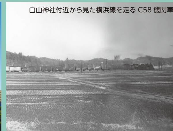
白山神社付近から見た横浜線走る C58 機関車