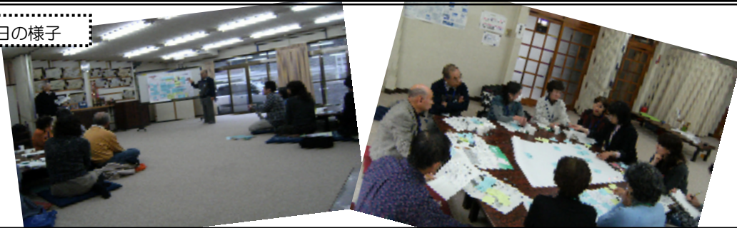
委員会当日の様子

平成22年2月27日(土)14時～16時、三保自治会館で「第1回三保地区・地区別計画策定委員会」を開催しました。今回は第1回目の委員会ということで、「三保地区ではどんな活動が取り組まれているか、三保地区の課題とは？」といったことを話し合いました。委員会で話し合われた内容を、地域の皆さんも是非ご覧下さい！