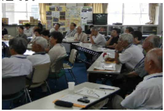
活発な意見が出ました。

その中でも、「地区別計画」は、日々の暮らしの中で起きている身近な地域での“福祉・保健”をはじめ生活に関する課題の解決に向けて、地域の皆さんが検討し、順序立てて取り組むための計画です。