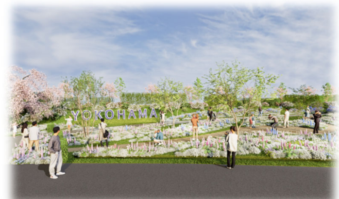
活動拠点 ウェルカムガーデン イメージ