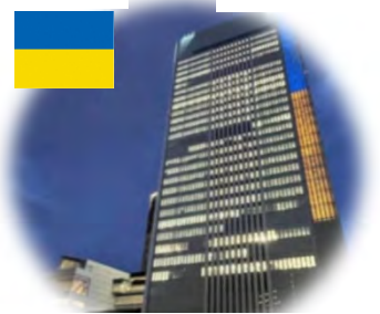
市庁舎を ウクライナ色に