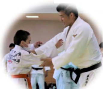
子どもたちの 柔道交流