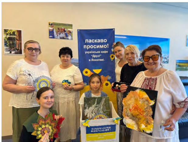
返礼品作製にご協力くださった ウクライナ避難民の皆様