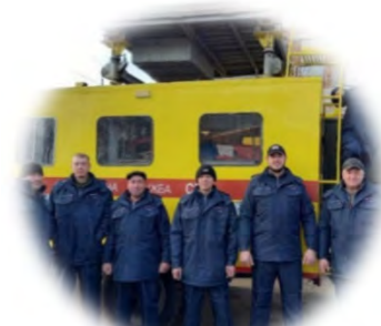
極寒の作業のための 約2,000着の防寒服