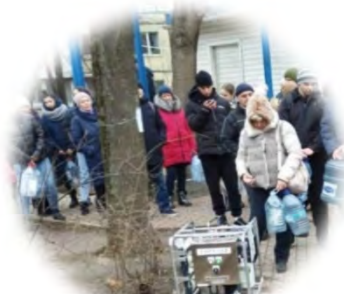
10万人分の緊急時 の飲み水確保