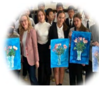
子どもたちの アート交流