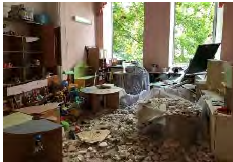
▲被害を受けた保育園の様子▲