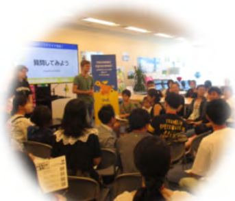
オール横浜で 避難民支援