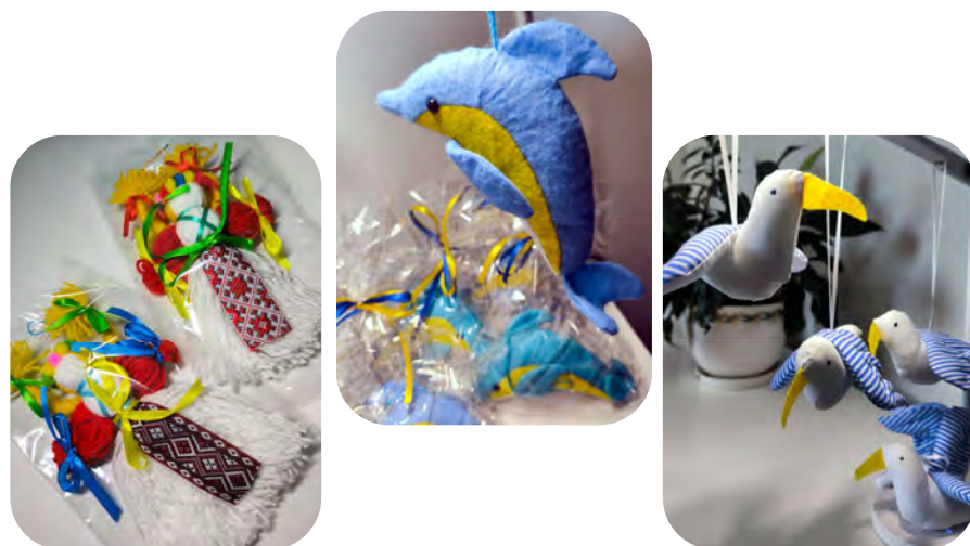
オデーサ市の子ども達や、ウクライナ避難民の 皆様による手作りの返礼品