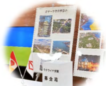
募金活動 計約4千万円

2022年ウクライナ侵略により危機に直面したオデーサ市からの要請に、国際機関や企業・市民の皆様と連携し、いち早く対応