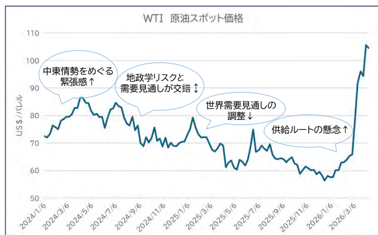
《中東情勢と原油価格の乱高下》