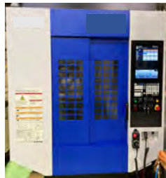
マシニングセンター