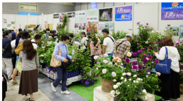
花・緑のショッピングも