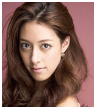
森 泉 (モデル・タレント)

バラエティ豊かな豪華ゲストが毎日登場 トークやデモンストレーションなど、多彩なプログラムをお楽しみいただけます