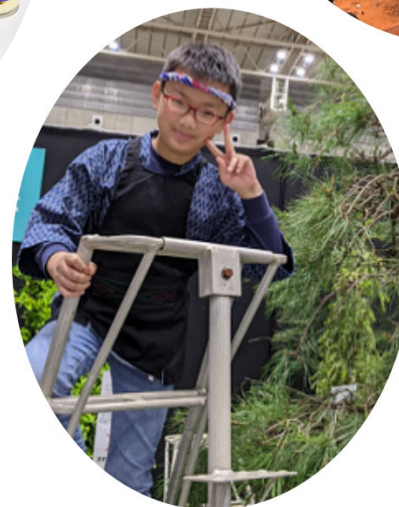
植木屋さんになってみよう 7