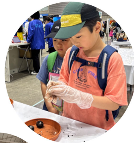
楽しい！ たねダンゴ