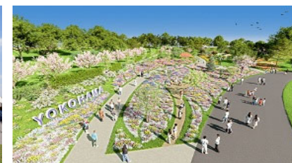
ホストシティ横浜市の取組発信