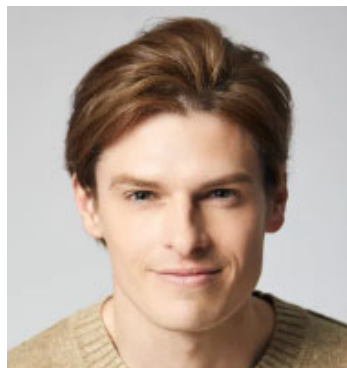
村雨 辰剛 (庭師・俳優)