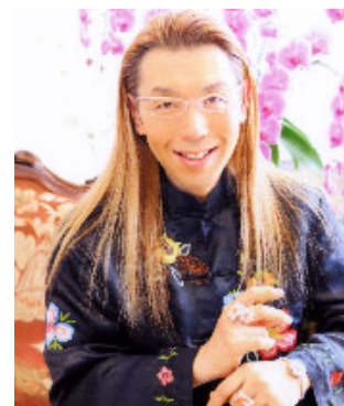
假屋崎 省吾 (華道家)