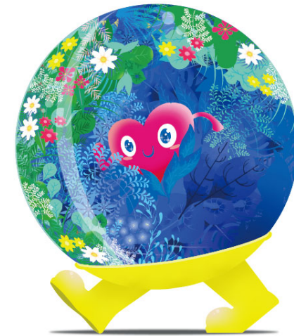
GREEN×EXPO 2027公式マスコットキャラクター 「トゥンクトゥンク」