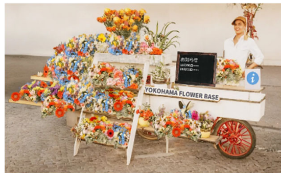
花の移動式観光案内所