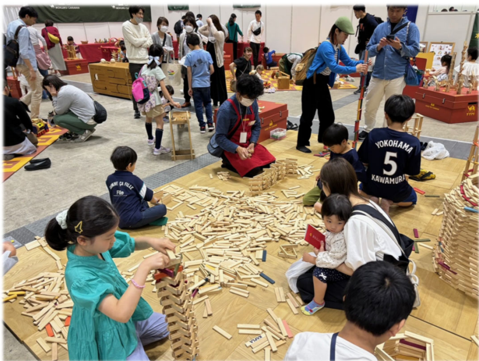
木育キャラバン 国産の木のおもちゃが大集合！