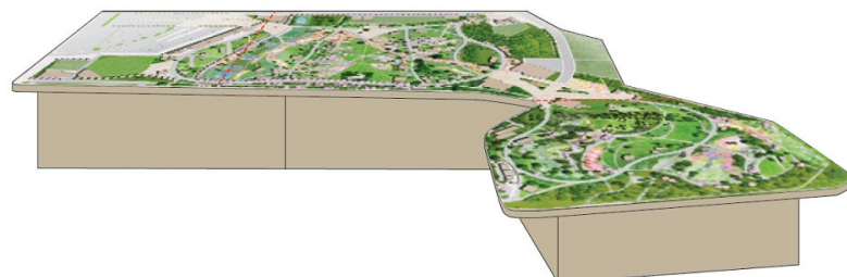
会場の大型マップ (3.6m×2.5m)