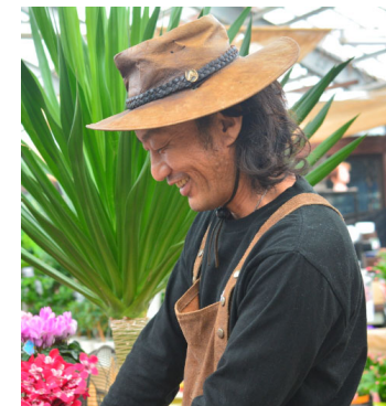
カーメン君 (園芸超人)

フラワーステージ (200席) とガーデンステージ (50席) の 2つのステージで、インフルエンサーや園芸家と より近くコミュニケーションをとりながらテクニックを伝えます。