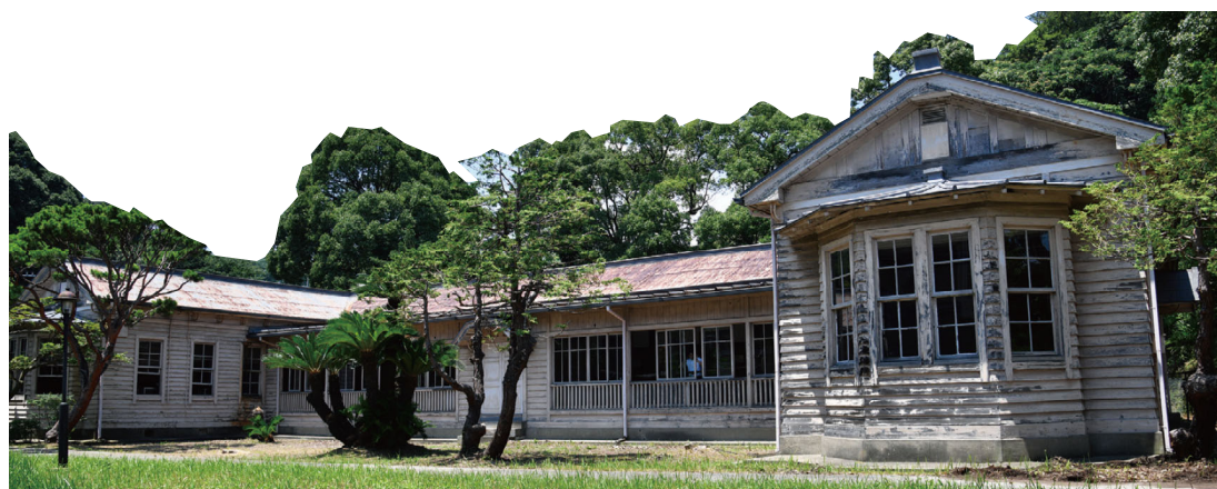
移築前の姿(R5年6月頃)