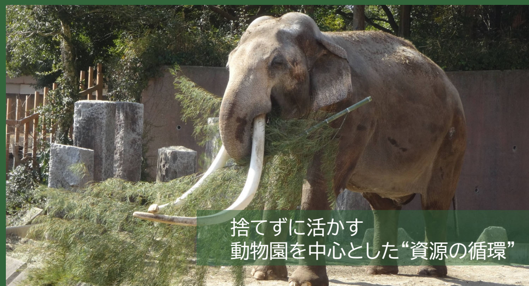
捨てずに活かす 動物園を中心とした“資源の循環”