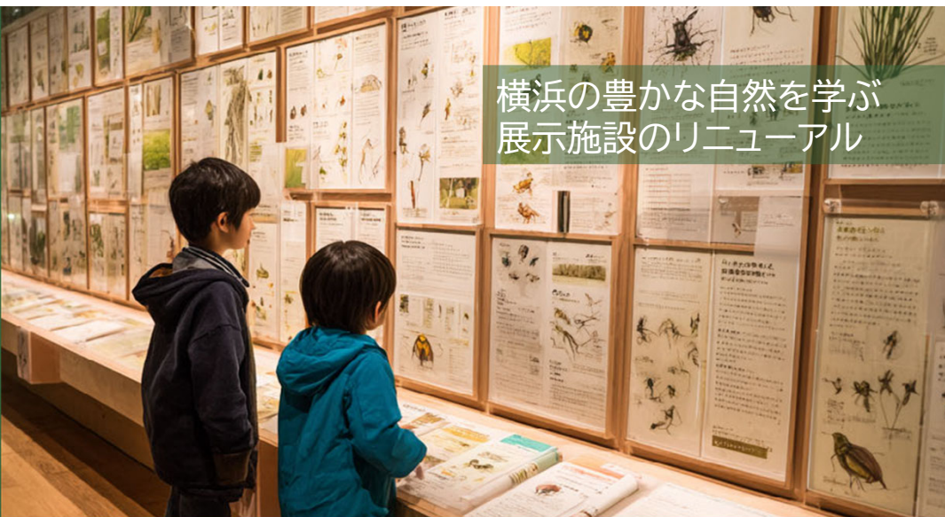
横浜の豊かな自然を学ぶ 展示施設のリニューアル