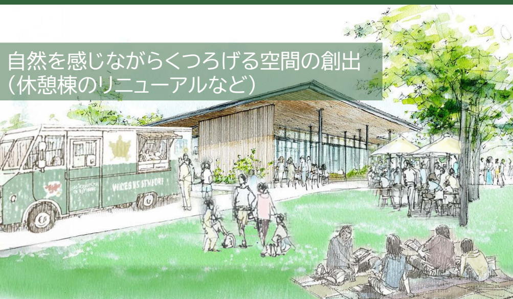
自然を感じながらくつろげる空間の創出 (休憩棟のリニューアルなど)