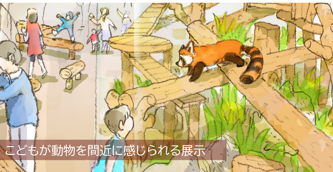
こどもが動物を間近に感じられる展示