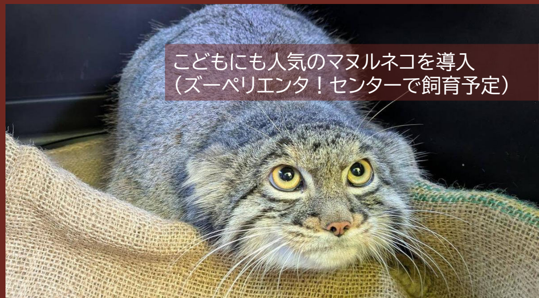
こどもにも人気のマヌルネコを導入 (ズーペリエンタ！センターで飼育予定)