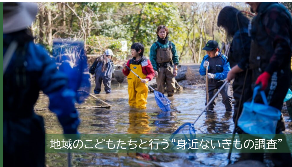
地域のこどもたちと行う“身近ないきもの調査”