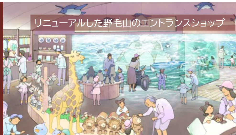
リニューアルした野毛山のエントランスショップ