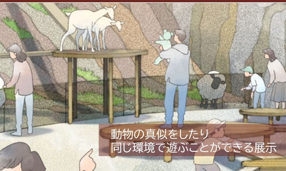
動物の真似をしたり 同じ環境で遊ぶことができる展示